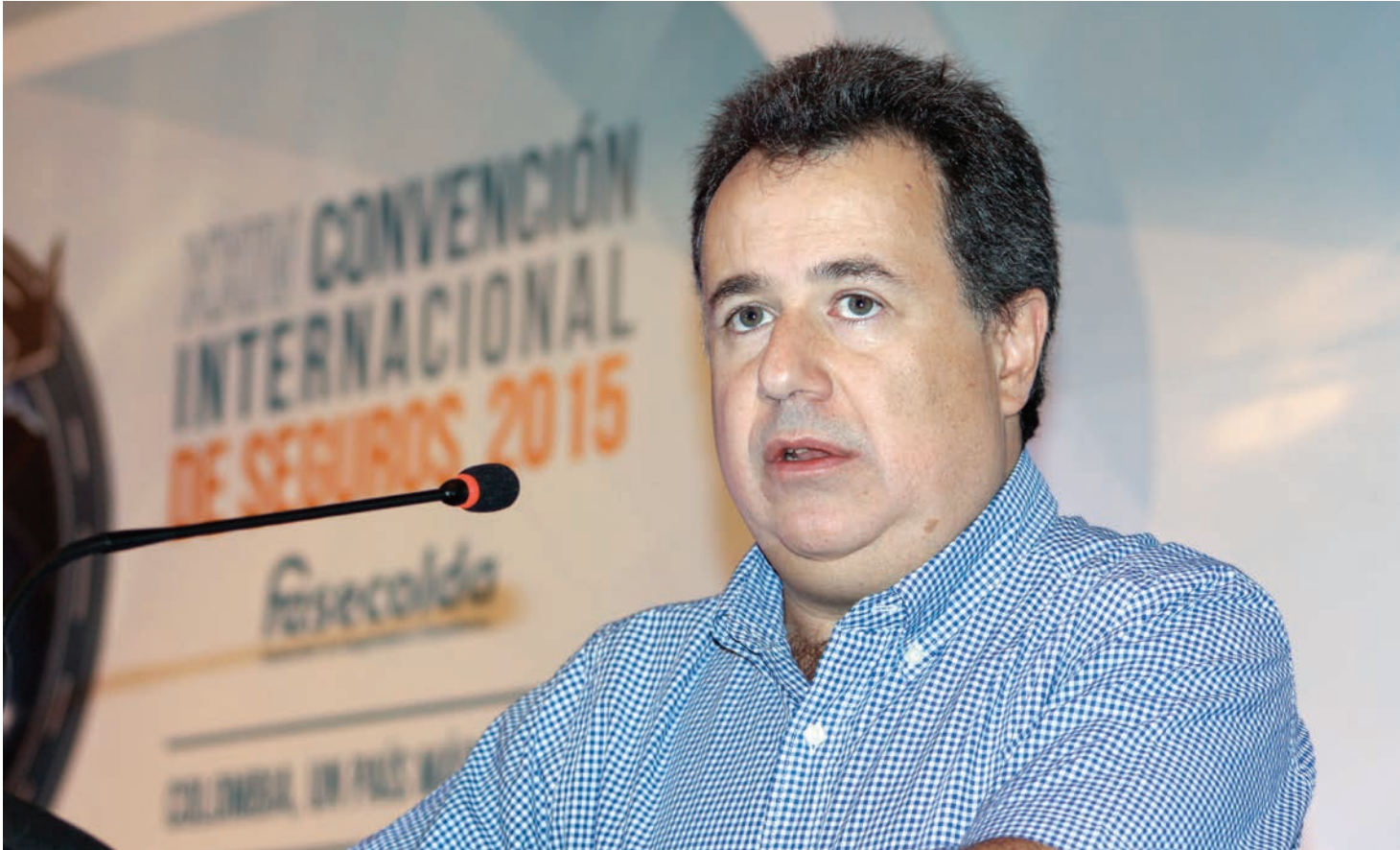
Mauricio Santa María Salamanca, exministro de Salud y ponente en la Convención

ble con cifras que no se presentaban desde el 2001 (6.346 casos). Así para el 2014, las muertes de accidentes de transporte se incrementaron en 2,94 % con respecto al 2013 y 18,16 % en relación con los casos presentados en el 2005».